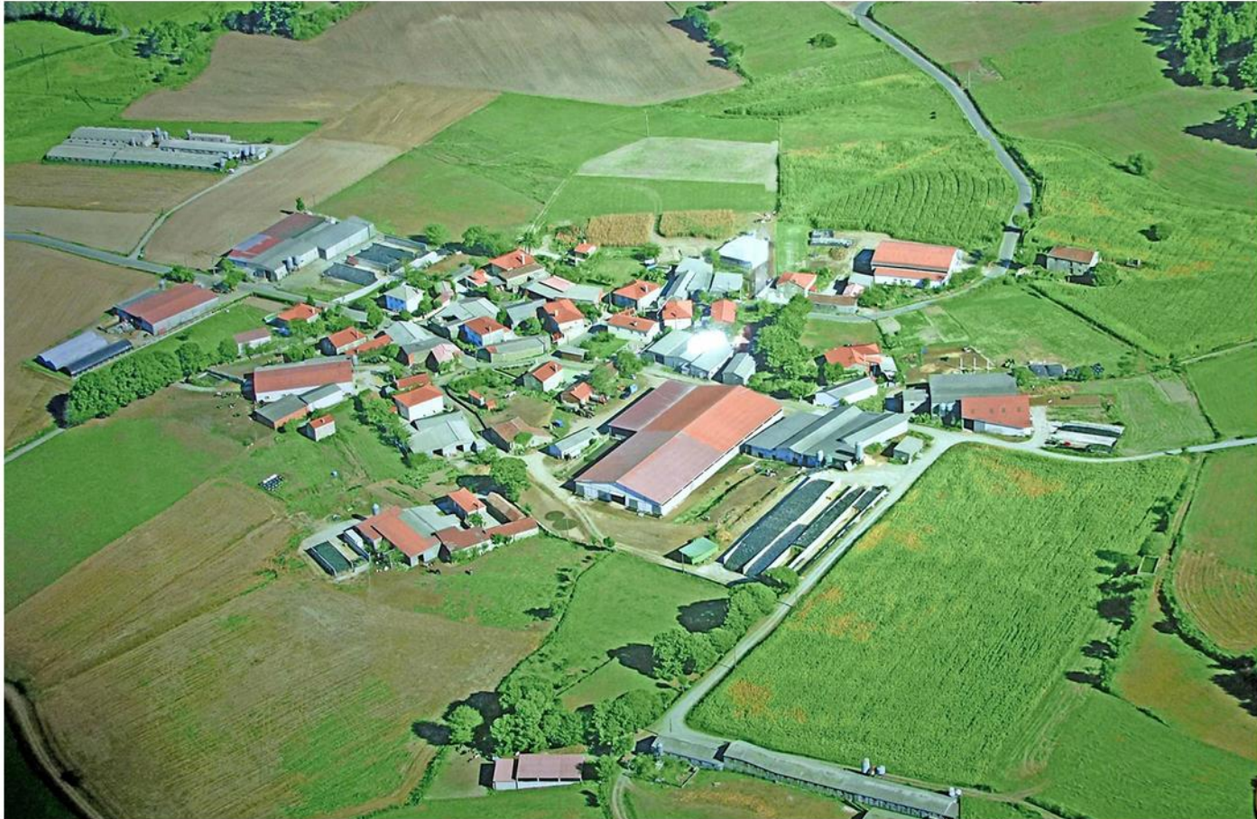
Sestelo, Escuadro (Silleda - Pontevedra)